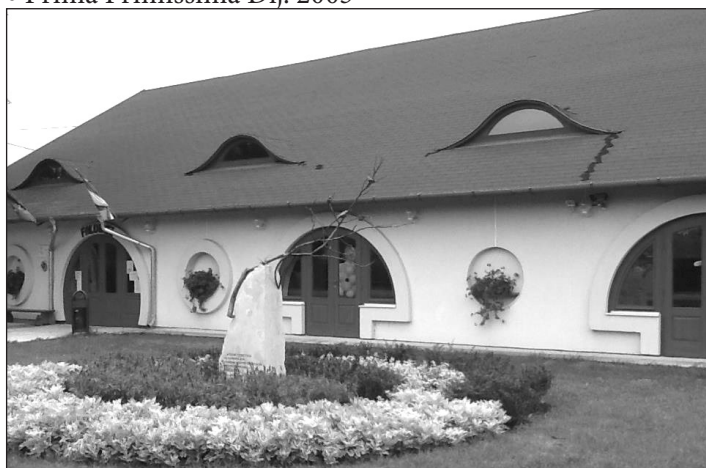
Csete György építész tervei alapján 2000-ben átalakított Faluház

Publikált, nyilatkozott, szerepet vállalt a nemzeti gondolat, a magyar lét és jövő érdekében, talán hiába?