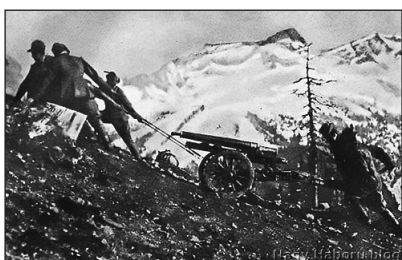
Mrzl hegy az I. világháborúban (mai Szlovénia)