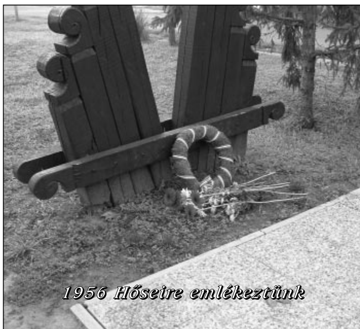
1956 Hőseire emlékeztünk