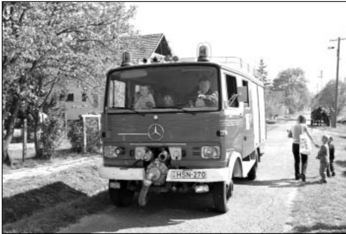
Nagy kedvenc a tűzoltóautó