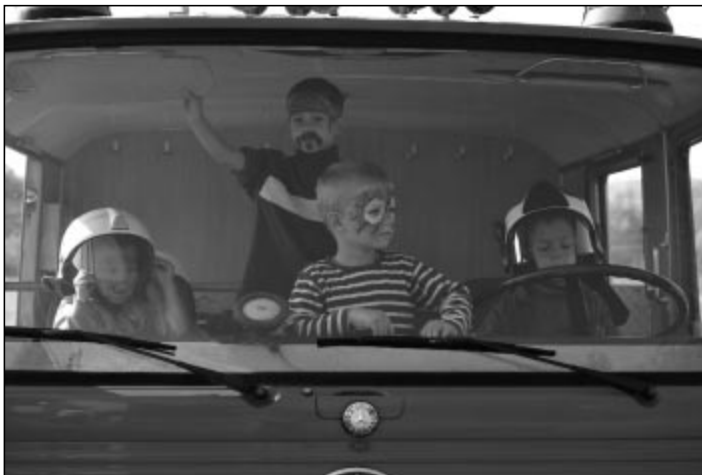
A jövő lánglovagjai