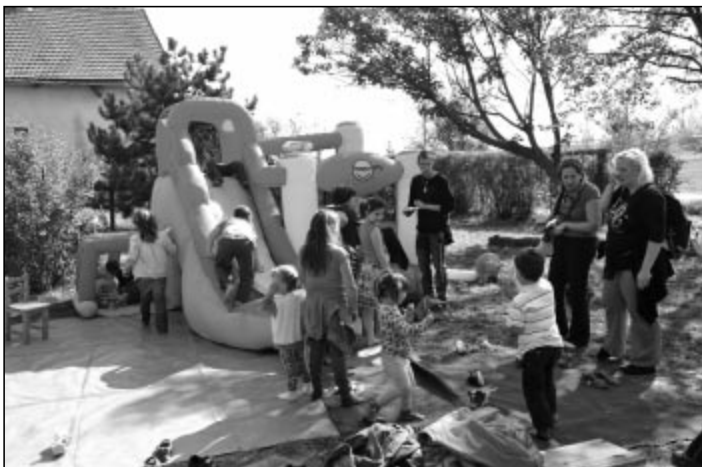
Az ugrálóvár nagy sikert aratott

A rendezvény bevételét a gyermekek fejlesztését szolgáló eszközök vásárlására és közösségi programok szervezésére fordítja a nevetlő testület és a szülői közösség