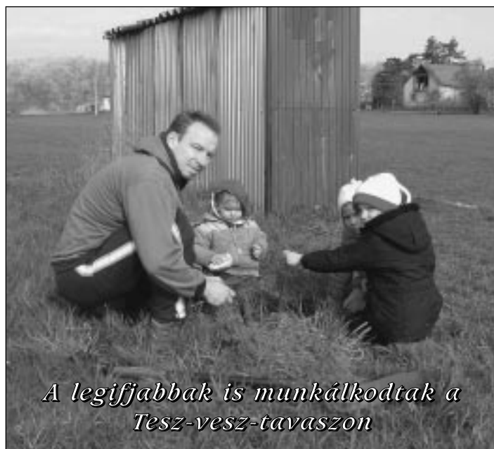
A legifjabbak is munkálkodtak a Tesz-vesz-tavaszon