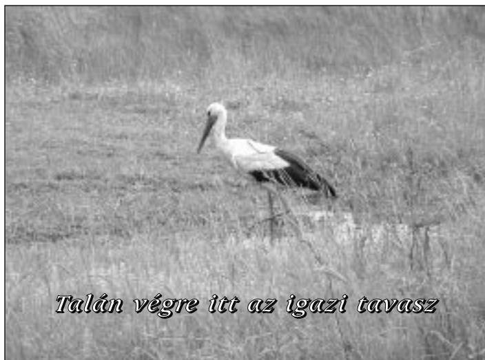
Talán végre itt az igazi tavasz