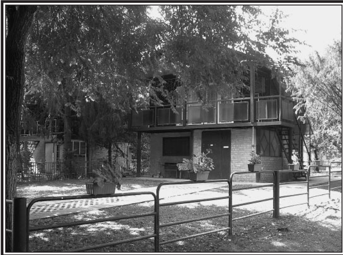
Mártélyi holtág – Tisza part – Dobó Ferenc Horgász Egyesület horgásztanyája