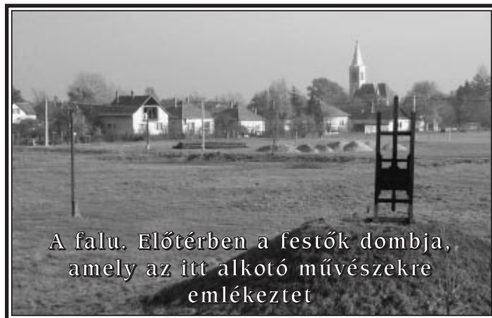
A falu. Előtérben a festők dombja, amely az itt alkotó művészekre emlékeztet