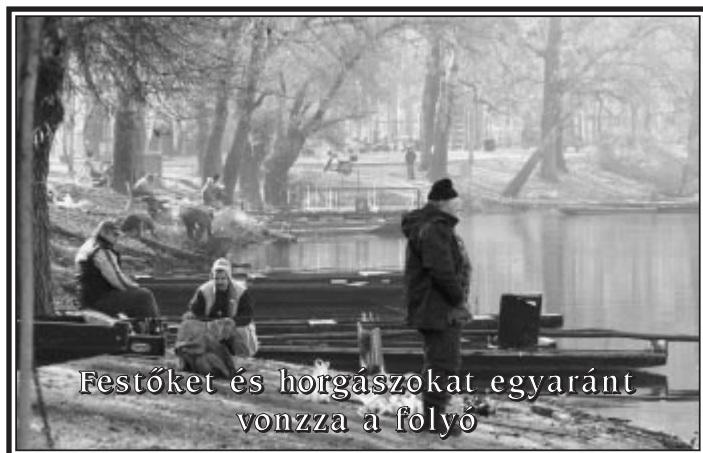
Festőket és horgászokat egyaránt vonzza a folyó

Óvoda, iskola, időseket gondozó szervezet működik a faluban. Mint sok ekkora helyen, csak egy kicsit másképpen. Egy-két példa: az iskolásokat a fővárosi Operettszínház koreográfusa tanítja táncra, az idősek otthonának programja a házi betegápolástól a legvidámabb bulikig terjed, kinek-kinek egyéni igénye szerint.