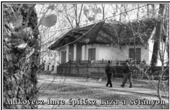
Makovecz Imre építész háza a sétányon